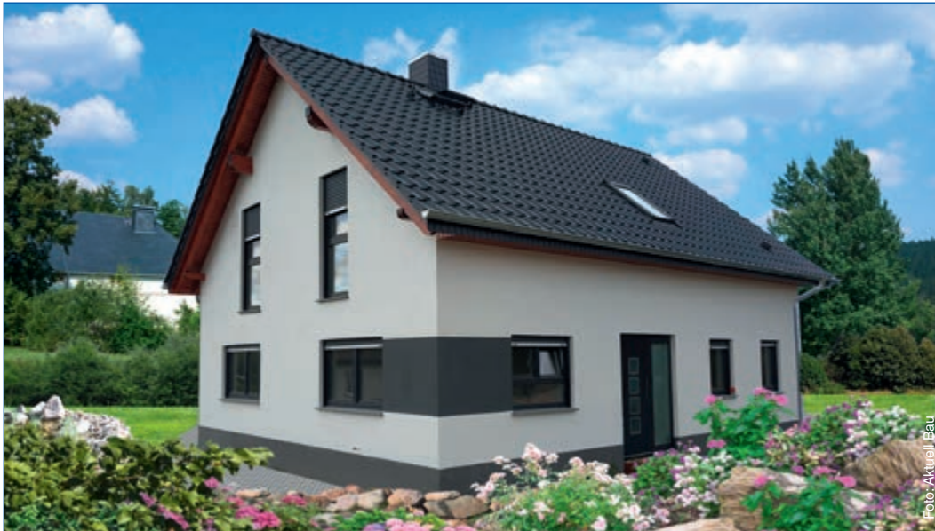
Modernes Einfamilienhaus mit Massivdrempe