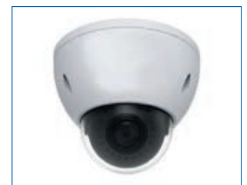
SECTRA® Megapixel Kamera

kann das Eindringen des Täters und größerer Schaden verhindert werden. Außerdem kann neben der Einbruchsüberwachung auch eine Brandüberwachung über die Alarmanlage erfolgen. Mit Kameras ist eine Überprüfung der am Haus befindlichen Personen über Smartphone möglich und zur Täterermittlung durchaus hilfreich.