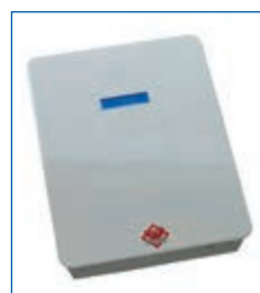
SECTRA® Zentrale 3.2 PRO mit Sensorik

Elektronischer Einbruchschutz heißt, dass mit einer Alarmanlage zum einen der Einbrecher verschreckt und zum anderen eine Alarmierung des Wachdienstes/der Polizei erfolgt. Sinnvoll sind Alarmanlagen, die bereits bei dem Versuch ins Gebäude einzudringen, Alarm auslösen. So